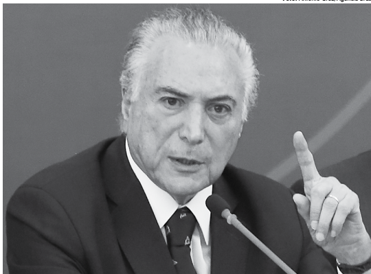
Temer está preocupado com o racha no PMDB por que pode atrapalhar a aprovação das reformas no Congresso

A briga interna do PMDB envolvendo nomes da cúpula da legenda também tem se agravado, segundo auxi-