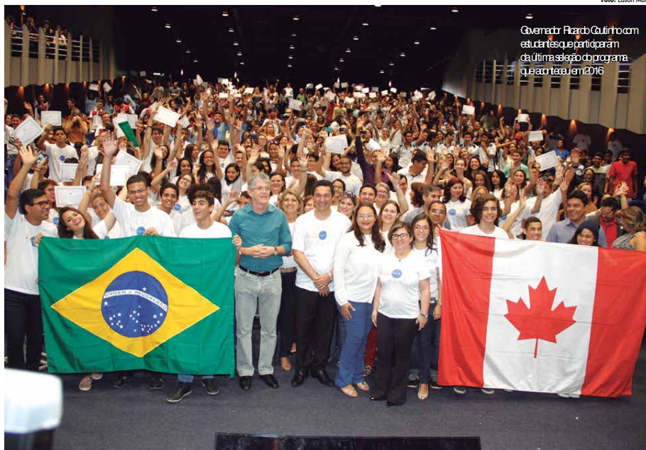
Governador Ricardo Coutinho com estudantes que participaram da última seleção do programa que acontecerá em 2016

Para participarem do intercâmbio, os candidatos devem ter, no mínimo, 14 anos de idade até o dia primeiro de julho de 2017 e no máximo 17 anos e 6 meses até o dia primeiro de julho de 2017; estar regularmente matriculado no segundo ano do Ensino Médio regular, normal médio, semi-integral, integral ou médio integral integrado à educação profissional das escolas públicas