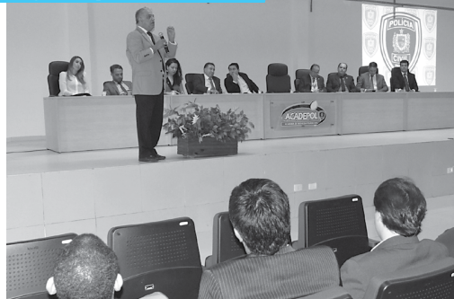
Aula de boas-vindas para alunos do curso de Direito de três universidades a ser feita na última quinta-feira