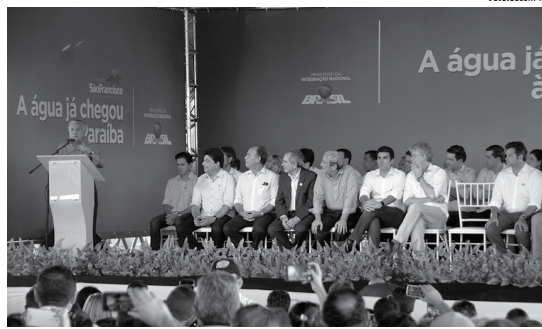
Solenidade com a participação do presidente da República, Michel Temer e ministros do Governo Federal

O presidente Michel Temer ressaltou que a transposição do Rio São Francisco dará uma nova vida para os moradores das regiões castigadas, durante anos, pela seca. "Cuide de Monteiro a honra de ser a porta de entrada das águas do Rio São Francisco na Paraíba. Estou feliz em estar aqui e entregar o Eixo Leste desta obra que, desde o império, era debatida, mas só nos últimos anos foi executada. O Velho Chico e o Rio Paraíba vão andar de mãos dadas levando água para os