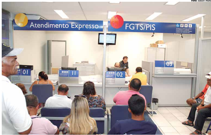
As agências da Caixa na Paraíba continuarão sendo abertas na próxima segunda e terça-feira, duas horas antes, para atender os trabalhadores

Cerca de 4,8 milhões trabalhadores em todo o país terão direito ao resgate do dinheiro das contas inativas do FGTS. O valor disponível para saque nesse mês ultrapassa os R$ 6,96 bilhões e equivale a 15,9% do total disponível.