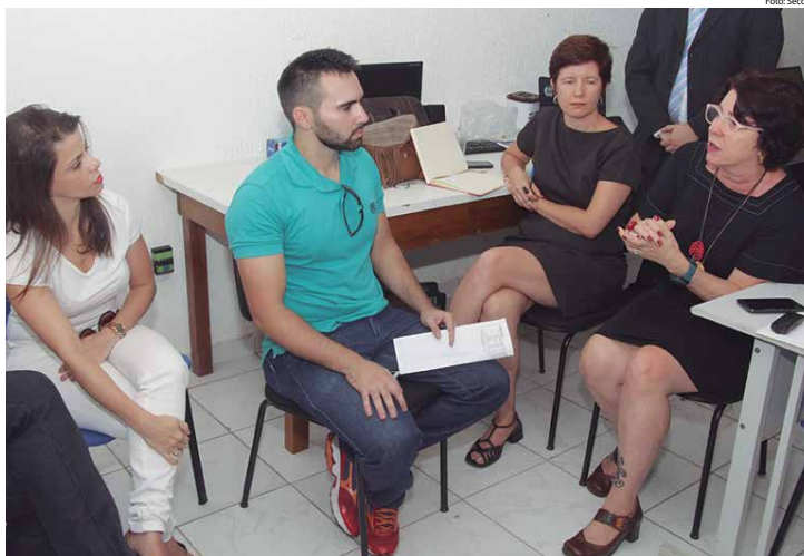
Comissão de Avaliação da Legalidade do Concurso Público emitiu relatório apontando erros e recomendando à prefeita a anulação do concurso

O decreto determina ainda que a Procuradoria Geral do Município adote as medidas legais, visando a responsabilização dos que deram causa a anulação do concurso, buscando o ressarcimento ao erário público.